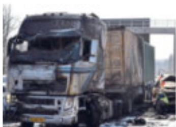
Um 9.30 Uhr brannte auf der A8 bei Pforzheim-Süd ein Lastwagen aus.

Pforzheim – Das Führerhaus ist verkohlt, die Scheiben sind gebersten. Rauch steigt auf, während Feuerwehrleute den Laster einschäumen.